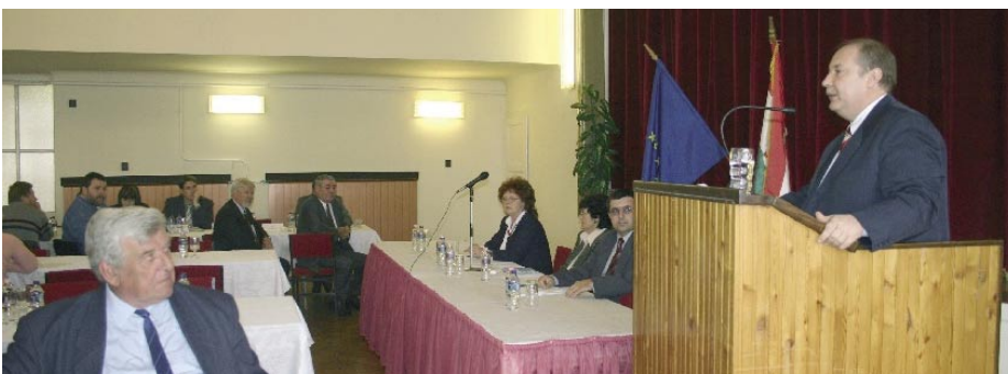
KISS PÉTER MÉG MUNKAÜGYI MINISZTERKÉNT. ELADTÁK AZ ÜDÜLÖKET

Nagy Sándor jó időben, jó helyen volt. Horn Gyula elnöksége idején az MSZP vezetése fontos tényezőnek tekintette az MSZOSZ-t. A Horn-kormány szakszervezeti irányítás alá tette a társadalombiztosítást, ami azonban nem jelentett valószínű társadalmi ellenőrzést, hanem csupán az MSZP-MSZOSZ-elit uralmát jelentős anyagi források felett. Cserébe az MSZOSZ teljes mértékben az MSZP-kormányok kiszolgálójává vált. A kép teljességéhez hozzátartozik, hogy Nagy Sándor nem értett egyet a Horn-kormány privatizációs politikájával, és 1995-ben le is mondott az MSZOSZ elnöki tisztségéről. A lényegében azonban ez nem változtat. Hosszú ideig parlamenti képviselő, mondani sem kell, hogy MSZP-színében, majd a Medgyessy- és Gyurcsány-kormányban államtitkár. 2006-ban Gyurcsány szabadulni igyekszik az MSZP régi csapatától, így Nagynak is mennie kell. A jól csengő nevű Regionális Fejlesztési Holding Zrt. elnökeként keresi a betevő falatot. ■