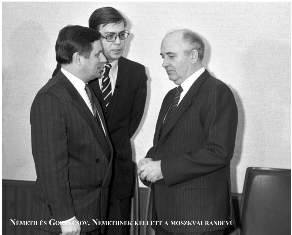
NÉMETH ÉS GORBACSOV. NÉMETHNEK KELLETT A MOSZKVAI RANDEVŰ

Németh sehogyan sem tudja elérni, hogy Gorbacsov kerekperek igent mondjon a többpártrendszerre, de végül kiprésel belőle egy mondatot: „Önök igaza van: ha a politikai mozgatóerőket nem használjuk ki annak érdekében, hogy egészséges gazdaságot teremtsünk, akkor elkerülhetetlenül elégedetlenség alakul ki a nép körében”. A magyar delegáció jelentésébe végül bekerül egy so-