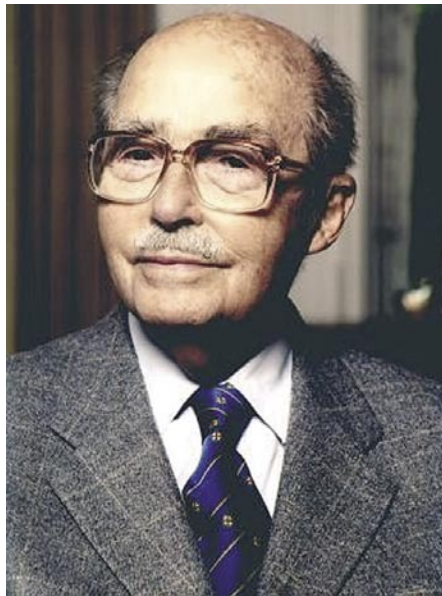
HABSBERG OTTÓ. A MAGYAR ELIT KÖRBERAJONGTA

Magyarországon minden létező média és persze a politikusok is magyarosan emlegetik az egykori királyi család sarját: Habsburg Ottó. Ezt semmi sem indokolja, legfeljebb az, hogy a rendszerváltás kori magyar politikai elitnek, miniszterelnököktől kezdve kis falusi polgármesterekig nagyon is tetszett a monarchia bűvkörében megmártózni. Otto von Habsburg 1912-ben született. Apja IV. Károly, Ausztria császára és Magyarország királya volt. Mondhatnánk, hogy utolsó császára és királya, bár ezt soha sem tudni. Mindenesetre Ottónak elvben semmilyen joga nincs akár az osztrák, akár a magyar trónt igényelni, mivel megfosztották őt a lehetőségtől, Magyarországon például már 1921-ben. Plusz ő maga is lemondott trónigényéről. Igaz, nem siette el, hiszen 1961-ig várt vele. A Habsburgok képesek voltak minden helyzethez alkalmazkodni, nem véletlen, hogy évszázadokon át uralkodtak. Otto von Habsburg is megtanult mindent, amit egy császárnak és királynak illik tudnia. A magyar nyelvtudása például páratlan és a raccsolást leszámítva ma is kenterbe verne sok magyar politikust. Elég okos volt ahhoz, hogy idővel rájöjjön: a monarchikus vonalon nem sok babér terem, ezért