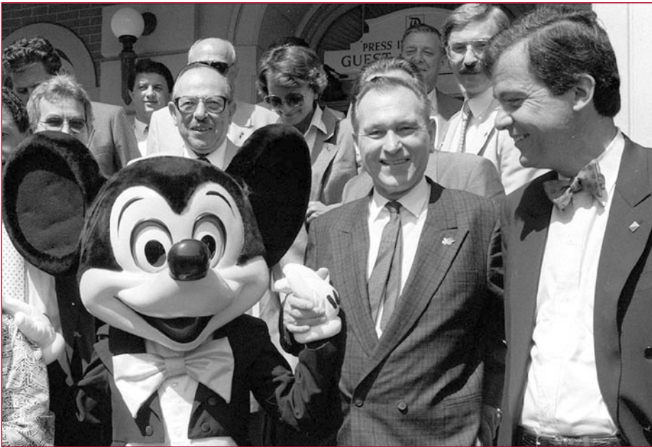
MICKEY MOUSE. RAJZFILMFIGURA