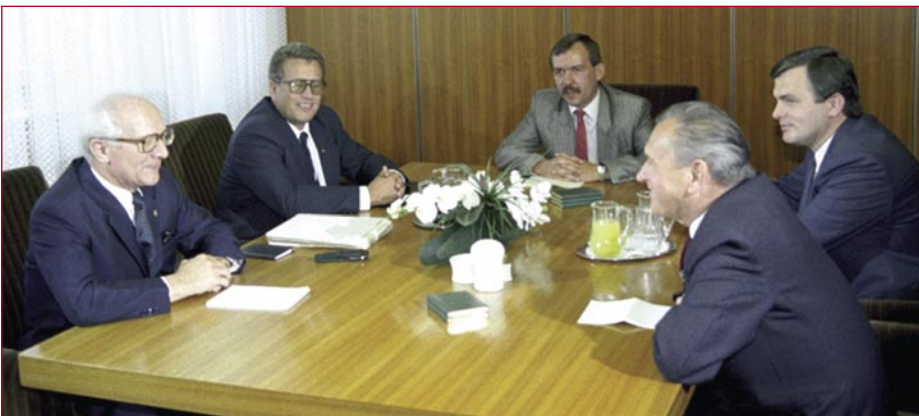
HONECKER HIÁBA FIGYELMEZTETETT