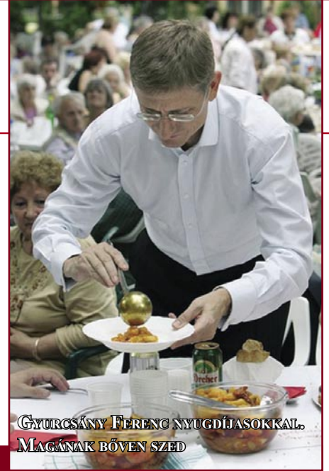
GYURCSÁNY FERENC NYUGDÍJASOKKAL. MAGÁNAK BŐVEN SZED