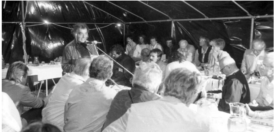
LAKITELKI TALÁLKOZÓ. AKKOR IS CSAK A SZOCIALIZMUS ELLENZÉSÉBEN ÉRTETTEK EGYET

re törekednek, egyes esetekben fellépnek szocialistaellenes erők is.” „Az MSZMP a maga részéről elutasítja az agresszív fellépést, az új politikai kultúrához méltatlan módszereket”.