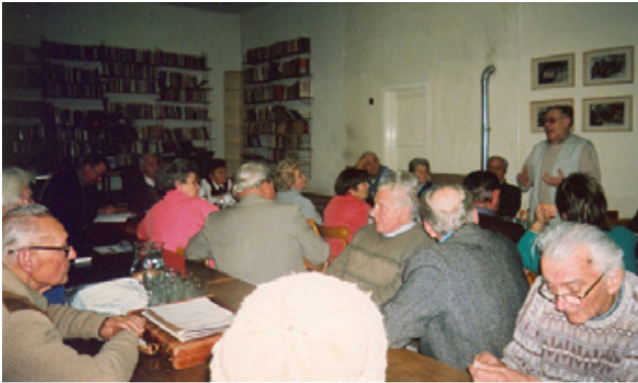
A ZUGLÓI PÁRTÉRTÉKEZLET

Karácsonyfa, szaloncukor, "A Szabadság" legújabb száma, kávé, tea, és sok vidám, mosolygós arc fogadta az elvtársakat Budapesten, Zuglóban, az Ilka utcában már délután 14 órától, ahol a Budapest 7. régió pártszervezete tartotta tisztújító taggyűlését. Rég nem látott elvtársak is érkeztek, pedig sötét