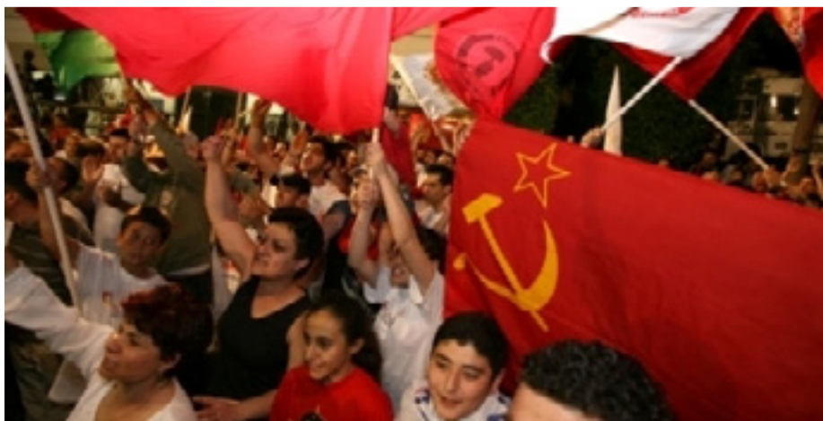
AZ ÜNNEPLŐ KOMMUNISTÁK

2006. december 17-én, vasárnap önkormányzati választásokat tartottak Cipruson, ahol polgármestereket, önkormányzati képviselőket és diákönkormányzatot választhattak a szavazók.