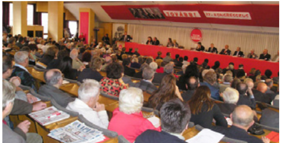
A MAGYAR KOMMUNISTA MUNKÁSPÁRT 22. KONGRESSZUSA

● Hogyan kell tanulni? A Központi Bizottság, az Elnökség, a megyei elnökségek, budapesti regionális elnökségek,