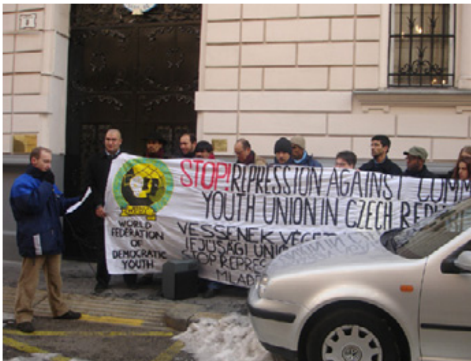
A DEMOKRATIKUS IEFJUSÁGI VILÁGSZÖVETSÉG ÉS A BALOLDALI FRONT - KOMMUNISTA IEFJUSÁGI SZÖVETSÉG KÖZÖS Tüntetése a Cseh Nagykövetség előtt 2006 februárjában

A Kommunista Ifjúsági Uniót (KSM) Csehországban hivatalosan feloszlatta az államhatalom 2006. október 12-én. 2006. október 16-án a KSM kapott egy levelet a cseh belügyminisztériumtól, amiben az áll, hogy a belügyminisztérium véglegesen feloszlatta a KSM-et. Ez annak ellenére történt, hogy nagy kampány folyt a fiatal kommunisták illegálizálásának veszélye ellen Csehországban.