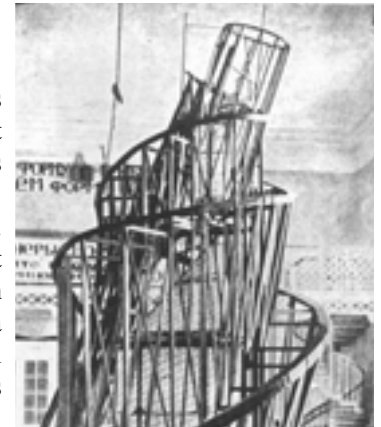
A INTERNACIONÁLÉ EMLÉKMŰVE

A szovjet-orosz konstruktőr, festő és grafikus Moszkvában született. Festészetére a fauvizmus és a kubizmus hatott. 1913-ban rövid párizsi tanulmányutat tett, s szobrászattal kezdett foglalkozni. 1913-15 között Moszkvában szabadon álló fa- és fémkonstrukciókat, ellentétes térbeli viszonyokat megvalósító reliefeket állított ki. 1919-ben K. Melevics és V. Kandinszkij mellett tagja volt a moszkvai Művészek Nemzetközi Irodájának. Leghíresebb munkája a III. Internacionálé emlékművének terve, 1920-ból. A torony majdnem fél kilométer magas lett volna, körvonalai egy kissé ferdén a magasba csavarodó spirált sejtettek, aminek belsejében hatalmas, henger és kúp alakú, lassú forgásban levő épületkomplexumok helyezkedtek volna el. Az 1920-as évektől főleg bútorok, kerámiák, ruhák és színpadi berendezések tervezésével foglalkozott. Őt tartották az orosz konstruktivizmus egyik úttörőjének. A művész 1953. május 21-én halt meg a szovjet fővárosban.