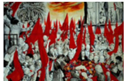
VÁZLAT TOGLIATTI TEMETÉSÉRŐL

Az olasz neorealizmus egyik vezető mestere Palermóban látta meg a napvilágot. Részt vett az antifasiszta mozgalmakban, tagja volt a Béke Világtanácsnak és az Olasz Kommunista Párt Központi Bizottságának. Képeinek témáját az olasz történelemből (Garibaldi csatája, 1951), a parasztság (Szicíliai szegényparasztok földfoglalása, 1948), valamint a munkásosztály életéből merítette (Rézbányász-sorozat). 1945-ben antifasiszta rajzszorozata jelent meg. Keresztrefésztetés című, 1941-ben festett képét, amellyel a Bergamói Biennálén díjat nyert, betöltötte a katolikus egyház. Guttuso tervezte Palmiro Togliatti, híres olasz kommunista vezető temetési szertartását.