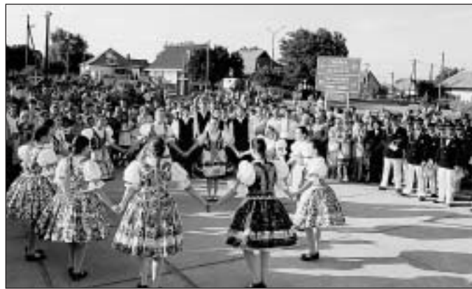
Őrzik a népi hagyományokat