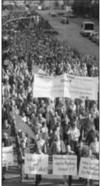
Felvonuló brémai munkások

● Wolfgang Clement német gazdasági és munkaügyi miniszter elismerte, hogy a munkanélküliek száma januárban elérte az ötmilliót, ami az előző ötven év rekordjának tekinthető. A legutóbbi „csúcs” 1998 januárjában volt, 4,82 millió munkanélkülivel. Az aktív korú lakosság között a munkanélküliség december végén 10,8 százalékos volt, 8,7 a nyugati és