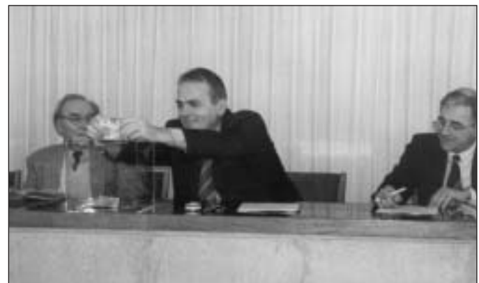
Elindult a Munkáspárt pénzügygyűjtési akciója