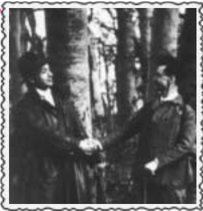
Illyés Gyulával Csillebércen, 1931-ben